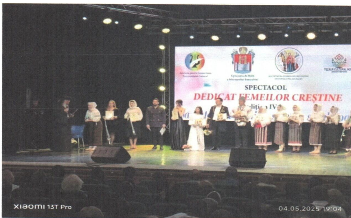
15 beneficiari din stagiul curent (IV) împreună cu familiile lor au fost invitați la spectacol dedicat femeilor unde a avut loc în Centrul de cultură municipal Bălți.