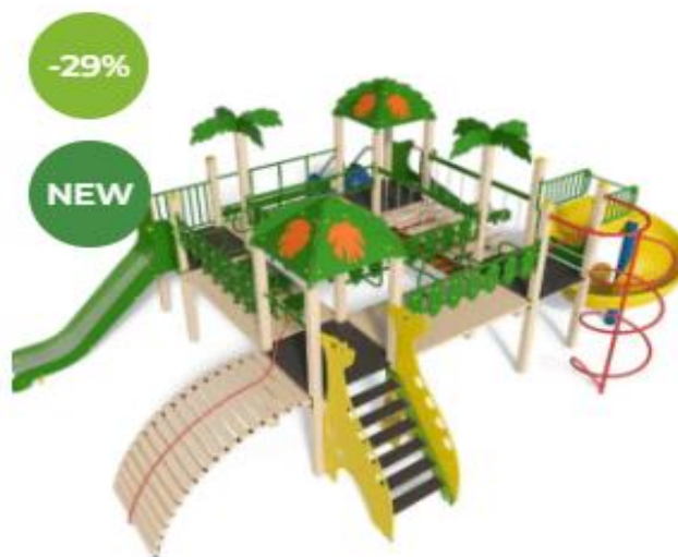
Complex de joacă PGS 2025 Palmier HDPE