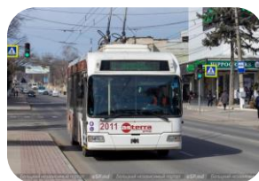
МП "Троллейбусное управление" - 8,1 %