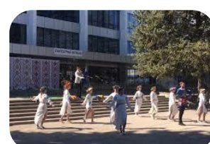
Управление Культуры - 3,7 %