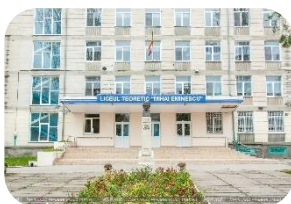
УОМС - 22,5 %