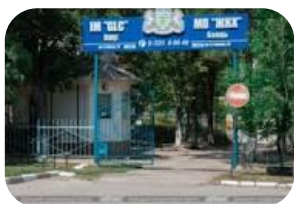
МП "ЖКХ" - 37,4 %