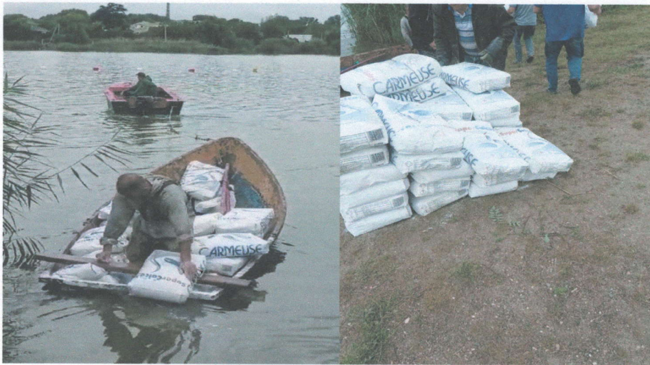
Дезинфекция воды в озере