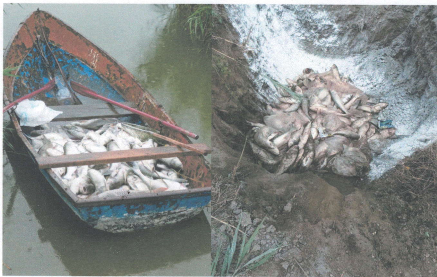
Сбор, вывоз и утилизация мертвой рыбы

- Содержание спасательных станций: Для обеспечения полноценного и безопасного досуга жителей города спасательные станции оснащены новейшим водолазным оборудованием, снаряжением и плавсредствами. Для предупреждения несчастных случаев на воде организовано круглосуточное дежурство работников спасательных станций. Для оказания первой медицинской помощи пострадавшим, спасательные станции укомплектованы необходимыми медикаментами.