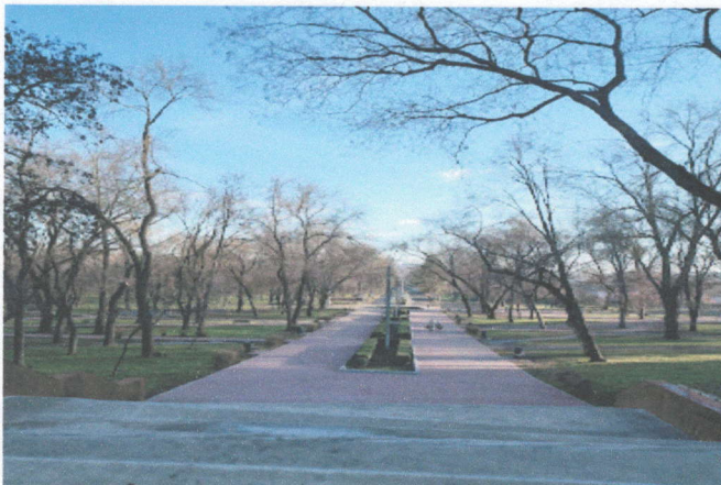
Городской центральный парк им. «М.Волонтир»

Предприятием выполнялись работы по уходу за зелеными насаждениями, газонами, розариями, цветниками, кустарниками, а также проводилась ежедневная санитарная уборка пешеходных дорожек и зеленых зон.