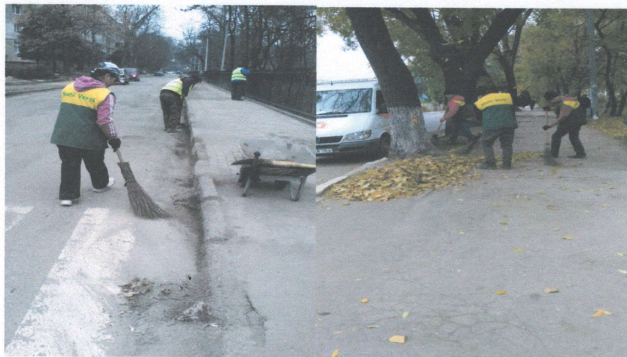
Очистка прибордюрной части и подметание тротуаров