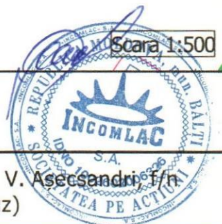
Schema de amplasament din piața V. Alecsandri, f/n (r-ul fântânei-havuz)