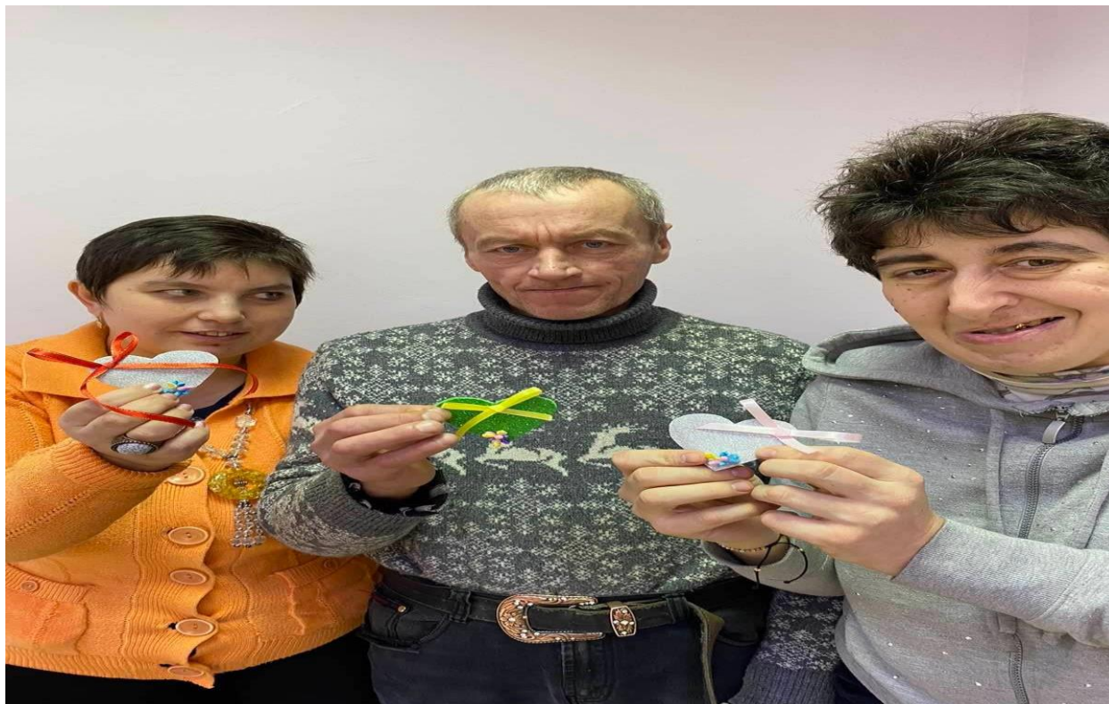
Manifestările organizate la CCSM pe parcursul anului 2023

Toate aceste activități sunt petrecute de către asistenți sociali medicali și de către psihologi. La moment este stabilit un grafic de ocupații unde sunt promovate activități atât creative cât și social-utile. Fiecare beneficiar frecventează activitățile în dependență de planul individualizat de asistență.