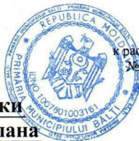
СХЕМА РАЗМЕЩЕНИЯ участков, отведённых для разработки Детального Градостроительного Плана