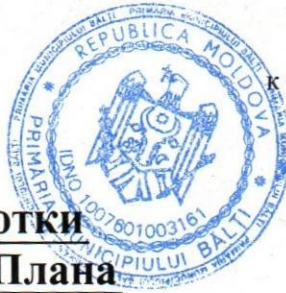
СХЕМА РАЗМЕЩЕНИЯ участков, отведённых для разработки Детального Градостроительного Плана